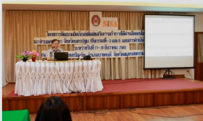
ภาพที่ 3 วิทยากรให้ความรู้เกี่ยวกับการพัฒนาผลิตภัณฑ์

นอกจากนี้ยังพบว่า การใช้แนวคิดการจัดการร่วมและการมีส่วนร่วมในกระบวนการนี้ทำให้กลุ่มตัวอย่างที่เป็นผู้ผลิตสินค้าประเภทขนมโบราณ ได้มีส่วนร่วมในกระบวนการคิดสร้างสรรค์เพื่อการพัฒนา รูปแบบผลิตภัณฑ์ให้มีความน่าสนใจมากขึ้น เริ่มตั้งแต่การใช้ความคิดสร้างสรรค์ในการตั้งชื่อผลิตภัณฑ์ ข้าวตูปั่นมือ จากเรื่องเล่าประวัติความเป็นมาของขนมข้าวตู ตลอดจนการมีส่วนร่วมในการแสดงความคิดเห็น เกี่ยวกับรูปแบบโลโก้ (ตราสินค้า) ร่วมกับทีมบุคลากร