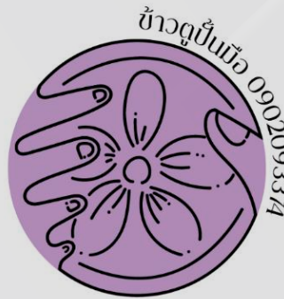
ภาพที่ 6 โลโก้ แบบที่ 3

ขั้นตอนที่ 5 การนำโลโก้ (ตราสินค้า) ที่ได้รับการปรับปรุงแก้ไขจากขั้นตอนที่ 4 ไปใช้งานจริง