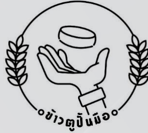
ภาพที่ 5 โลโก้ แบบที่ 2