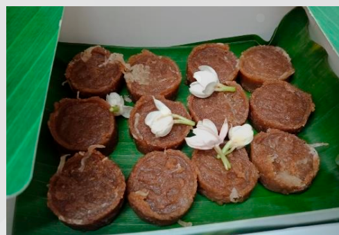
ภาพที่ 2 ขนมข้าวตุพร้อมทาน