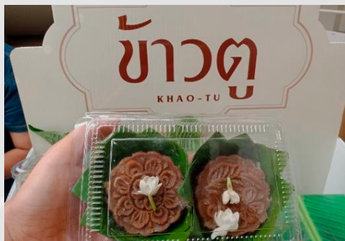
ภาพที่ 1 ขนมข้าวตุ

ผลการวิจัยพบว่า กลุ่มตัวอย่างในเขตพื้นที่ หมู่ 1 ตำบลศาลายา จังหวัดนครปฐม มีการรวมกลุ่มกันเพื่อผลิตสินค้าจากวัตถุดิบที่มีอยู่ในพื้นที่ออกจำหน่ายนักท่องเที่ยวและผู้บริโภคทั่วไปที่อาศัยอยู่ในพื้นที่ใกล้เคียง อย่างเช่น ขนมโบราณที่มีชื่อว่า ข้าวตุ ก็เป็นหนึ่งในสินค้าที่มาจากภูมิปัญญาชาวบ้าน และมีประวัติความเป็นมาที่ยาวนานคือว่าขนมข้าวตุ เป็นภูมิปัญญาที่ตกทอดจากรุ่นสู่รุ่น ครอบครัวยุคแรกๆรักษาและพัฒนาเพิ่มมูลค่าต่อไป แม้ว่าขนมข้าวตุจะมีประวัติความเป็นมาที่น่าสนใจ แต่รายได้จากการขายก็ยังไม่ดีเท่าที่ควร เนื่องจากผลิตภัณฑ์และบรรจุภัณฑ์ยังขาดความน่าสนใจสำหรับใช้ดึงดูดผู้บริโภค สอดคล้องกับ (สุนิษา กลิ่นขจร, 2558) ศึกษาเรื่อง การพัฒนาศักยภาพวิสาหกิจชุมชนกลุ่มผลิตภัณฑ์ลูกประคบสมุนไพร บ้านเขานาใน ตำบลต้นยวน อำเภอพนม จังหวัดสุราษฎร์ธานี ผลการวิจัยพบว่า การผลิตและการแปรรูป วัตถุดิบยังไม่เพียงพอต่อการผลิต ทำให้ไม่เพียงพอต่อความต้องการของตลาดขาดเครื่องมือที่ทันสมัย การแปรรูปไม่ผ่านมาตรฐานผลิตภัณฑ์ชุมชน ด้านการตลาด ขาดการประชาสัมพันธ์ การโฆษณาไม่ดีเท่าที่ควร ทำให้ผู้บริโภคไม่ค่อยรู้จักผลิตภัณฑ์