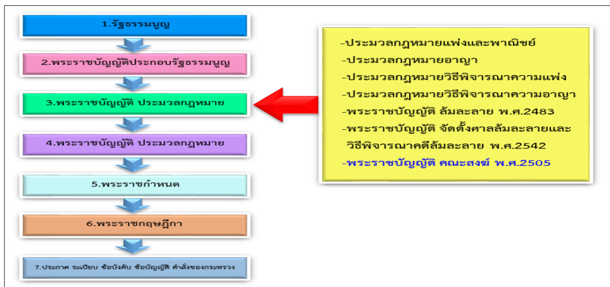
ภาพที่ 2 กฎหมายลำดับศักดิ์ พระราชบัญญัติ ประมวลกฎหมาย

ตามที่ได้ศึกษาพระราชบัญญัติคณะสงฆ์ พ.ศ. 2505 มีกฎหมายแม่บททั่วไปเกี่ยวข้อง 6 ฉบับด้วยกัน ดังนี้ ประมวลกฎหมายแพ่งและพาณิชย์ ประมวลกฎหมายอาญา ประมวลกฎหมายวิธีพิจารณาความแพ่ง ประมวลกฎหมายวิธีพิจารณาความอาญา พระราชบัญญัติล้มละลาย พ.ศ. 2483 พระราชบัญญัติ จัดตั้งศาลล้มละลายและวิธีพิจารณาคดีล้มละลาย พ.ศ. 2542 ซึ่งกฎหมายทั้ง 6 ฉบับนี้รวมถึง พระราชบัญญัติคณะสงฆ์ พ.ศ. 2505 อยู่ในลำดับศักดิ์กฎหมายของประเทศไทย ลำดับที่ 3 พระราชบัญญัติ ประมวลกฎหมาย ดังนั้นจึงมีระดับศักดิ์ความเท่าเทียมเดียวกันในการบังคับใช้กฎหมาย ดังแสดงตามภาพที่ 2