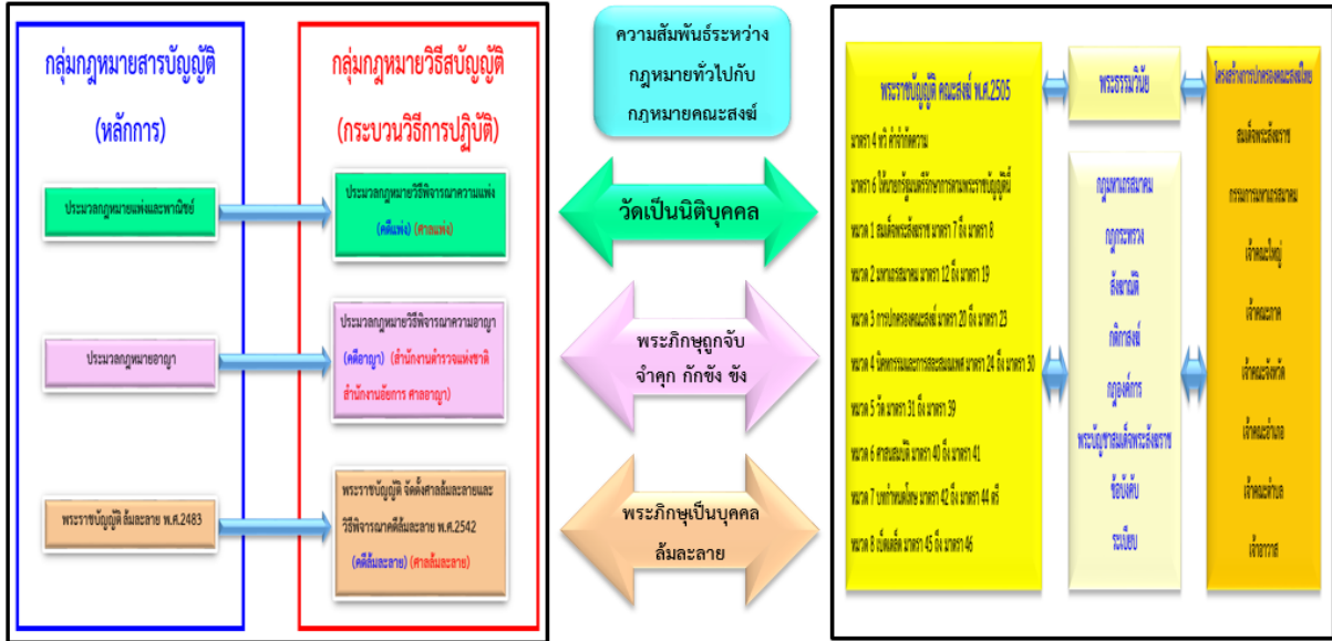
ภาพที่ 5 ความสัมพันธ์ระหว่างกฎหมายทั่วไปกับพระราชบัญญัติคณะสงฆ์ พ.ศ. 2505