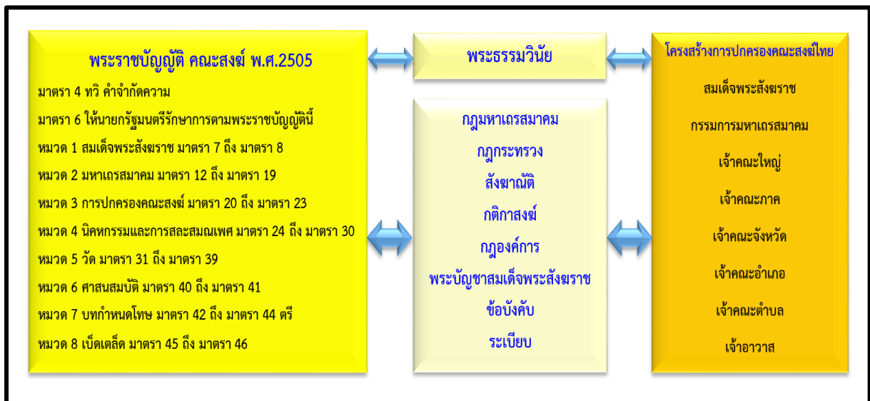
ภาพที่ 4 โครงสร้างการปกครองคณะสงฆ์

การปกครองคณะสงฆ์จะอยู่ในอำนาจหน้าที่การควบคุมดูแลโดยมหาเถรสมาคม ตามบทบัญญัติมาตรา 15 ตรี มหาเถรสมาคมมีอำนาจหน้าที่ ดังต่อไปนี้ (1) ปกครองคณะสงฆ์ให้เป็นไปโดยเรียบร้อยดีงาม (2) ปกครองและกำหนดการบรรพชาสามเณร (3) ควบคุมและส่งเสริมการศาสนศึกษา การศึกษาสงเคราะห์ การเผยแผ่ การสาธารณูปการ และการสาธารณสงเคราะห์ของคณะสงฆ์ (4) รักษาหลักพระธรรมวินัยของพระพุทธศาสนา (5) ปฏิบัติหน้าที่อื่นๆ ตามที่บัญญัติไว้ในพระราชบัญญัตินี้หรือกฎหมายอื่น เพื่อการนี้ ให้มหาเถรสมาคมมีอำนาจตรากฎหมายมหาเถรสมาคม ออกข้อบังคับ วางระเบียบ ออกคำสั่ง มีมติหรือออกประกาศ โดยไม่ขัดหรือแย้งกับกฎหมายและพระธรรมวินัยใช้บังคับได้ และจะมอบให้พระภิกษุรูปใดหรือคณะกรรมการหรือคณะอนุกรรมการตามมาตรา 19 เป็นผู้ใช้อำนาจหน้าที่ตามวรรคหนึ่งก็ได้ ดังนั้นโครงสร้างการปกครองคณะสงฆ์ แสดงตามภาพที่ 4