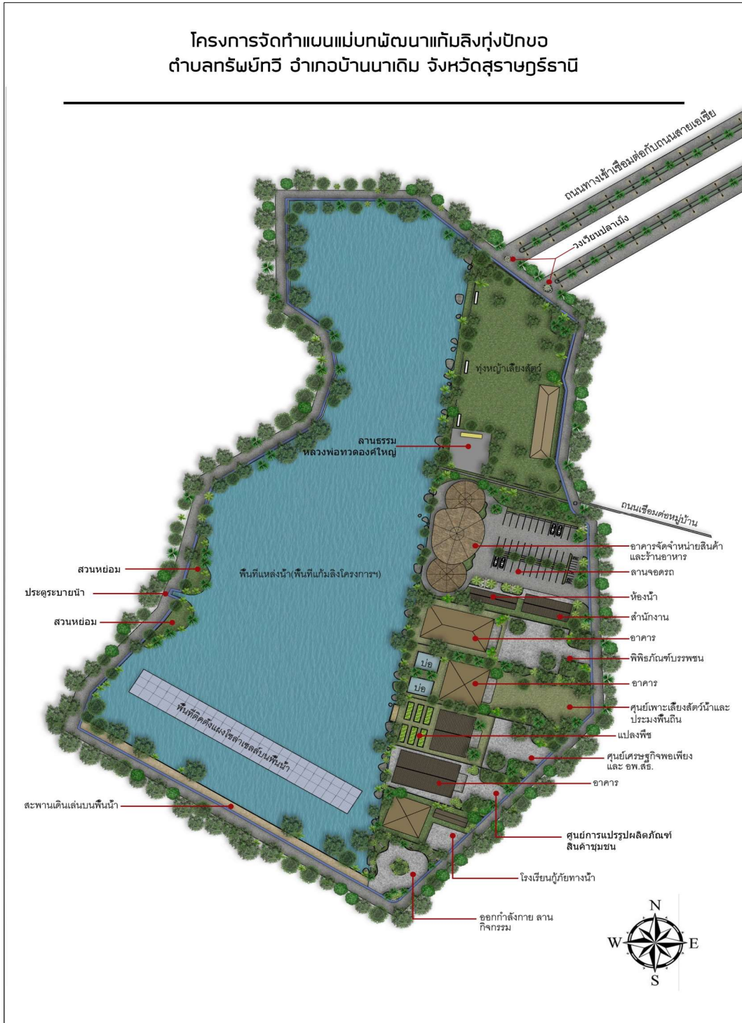
ภาพที่ 1 ผังแม่บทโครงการพัฒนาแก้มลิงทุ่งปักขอ ตำบลทรัพย์ทวี อำเภอบ้านนาเดิม ฉบับสมบูรณ์