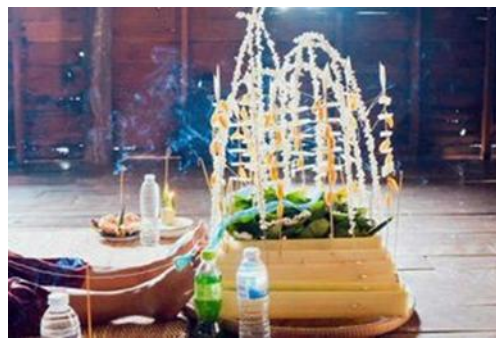
ภาพที่ 2 กระถางประกอบพิธีกรรมสะเดาะเคราะห์