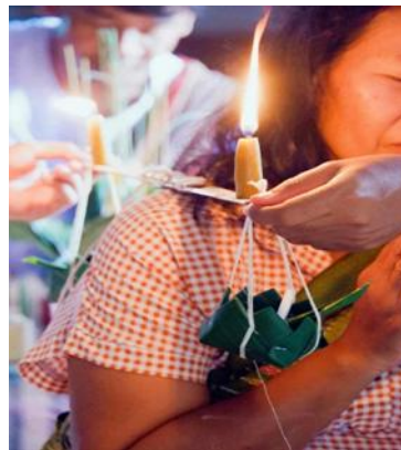
ภาพที่ 7 คานหามกระทง เพื่อใช้ประกอบพิธีกรรมสะเดาะเคราะห์

ในพิธีสะเดาะเคราะห์มักจัดชันน้ำมันต์ในการประกอบพิธีกรรมนี้ เพื่อใช้ในการประกอบพิธีกรรมสะเดาะเคราะห์ จำเป็นต้องมีชันน้ำมันต์จนกลายเป็นอัตลักษณ์ทางวัฒนธรรมท้องถิ่น วัตถุดิบเหล่านี้หาได้ในชุมชน