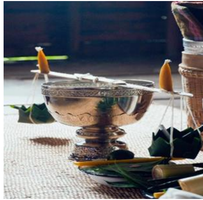
ภาพที่ 6 ชันน้ำมันต์ คานหามกระทง เพื่อใช้ประกอบพิธีกรรมสะเดาะเคราะห์