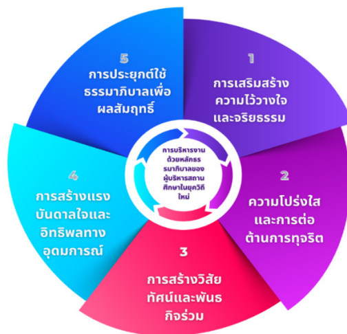
ภาพที่ 1 โมเดลธรรมาภิบาลของผู้บริหารสถานศึกษา ที่ส่งผลต่อการบริหารงานในสถานศึกษา