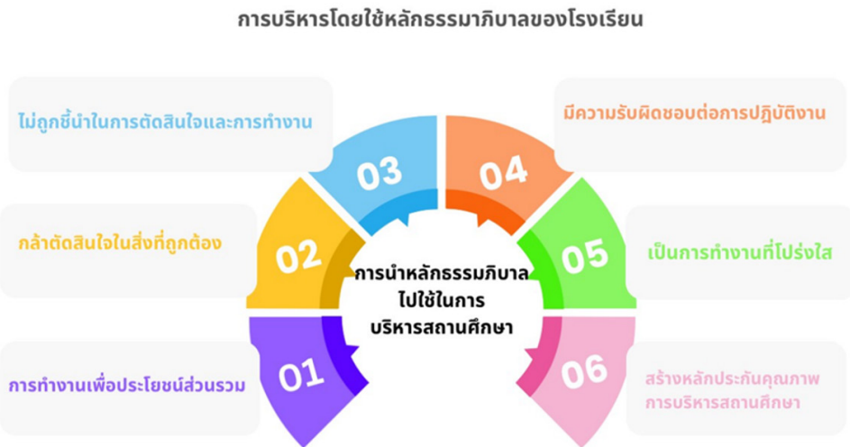
ภาพที่ 2 โมเดลองค์การนำหลักธรรมาภิบาลไปใช้บริหารโรงเรียนที่ส่งผลต่อสมรรถนะการปฏิบัติงานของครู